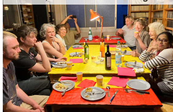
Au hasard, une des 9 tables de la Big fiesta

Maintenant, si vous voulez une Big fiesta sur trois jours, 100 fois plus grande et avec beaucoup plus de choses à faire... venez à la fête de la Lutte ouvrière le week-end de la Pentecôte !