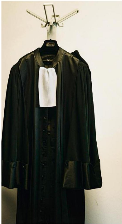
A gauche, dans la salle de permanence du parquet, Léa Lelièvre assure le suivi des courriels reçus, au palais de justice de Béthune (Pas-de-Calais), le 11 juin. A droite, la robe d'une magistrate.