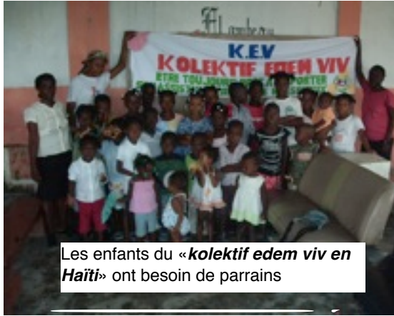
Les enfants du « kolektif edem viv en Haïti » ont besoin de parrains