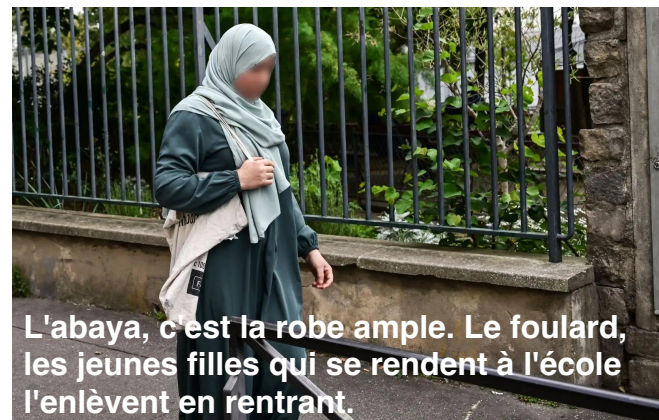
L'abaya, c'est la robe ample. Le foulard, les jeunes filles qui se rendent à l'école l'enlèvent en rentrant.

Les profs qui font face à cette montée progressive du repli nationaliste et religieux ont un rôle impossible. Certains s'essayeraient à mettre en oeuvre cette "véritable éducation" dont nous parlons plus haut, mais ils ne peuvent, de leur place, endiguer la montée de ce qui est le symptôme de l'échec de notre société.