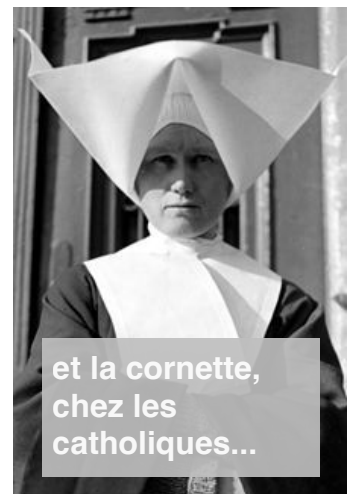
et la cornette, chez les catholiques...