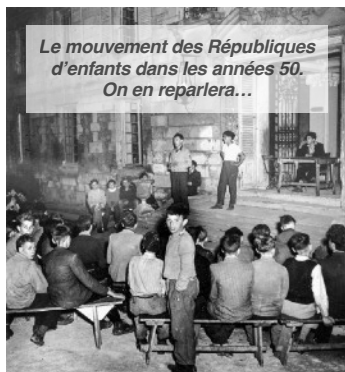
Le mouvement des Républiques d'enfants dans les années 50. On en reparlera...